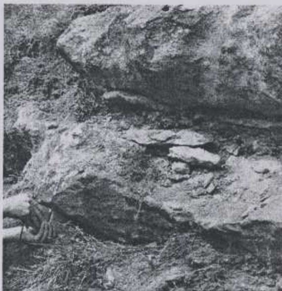
Slika 2. Slojevi željezovitih karbonatnih pješčara

Prvi veoma instruktivan profil nalazi se oko 70 m jugozapadno od B-6. Ovdje su markantni slojevi željezovitih karbonatnih pješčara debljine do 0,5 m (sl. 2.).