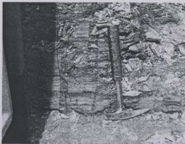
Slika 3. Laminirane laporovito pjeskovite gline

U raskopu koji je lociran oko 50 m jugozapadno od B-6 zastupljene su laminirane laporovito pjeskovite gline (sl.3.) koje leže na žučkastom karbonatnom pješčaru. Elementi pada slojeva ovih sedimenata su 352/10 stepeni.