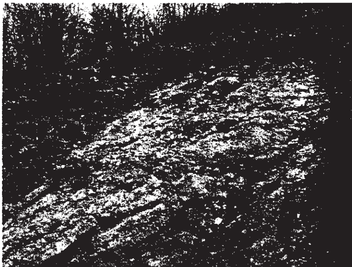
Slika 4. Slojevi brečastih konglomerata

Na sjevernoj padini Visočice, oko 30 m iznad bušotine B-3, nalazi se raskop dužine oko 10 m i širine oko 2 m. Ovdje se fino vide slojevi brečastih konglomerata (sl.4.). To su polimiktni konglomerati sa dominacijom karbonatnih valutica, različite granulacije (do desetak cm). Cement je karbonatni. Elementi pada slojeva su 10/26 stepeni.