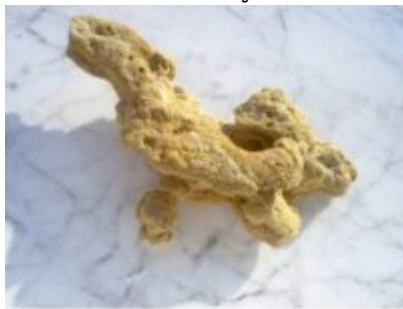
No.110: „Trogljevi zrnaj“ – prekrasna figurica, pronađena u trupu KTR Visoko, prilikom podgrađivanja zračnog ugostiteljske, među starijim objekatima materijalima, koji je iscurio u čelu troškova, 15 m pod zemljom. Dužina 190 mm. Sadržaj je od stambenog objekta, jako čvrstog koncentriranog pijeska – pijštara. (Foto: prof. dr. Marko Osmanagić, 14. decembar 2006)